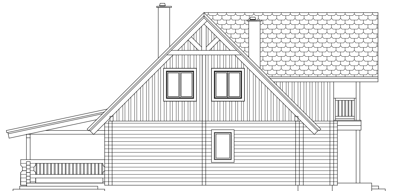
ELEWACJA BOCZNA skala 1 : 100

UWAGA: GÓRNA KRAWĘDZ OKIEN I DRZWI MOŻE NIE BYĆ NA TEJ SAMEJ WYSOKOŚCI