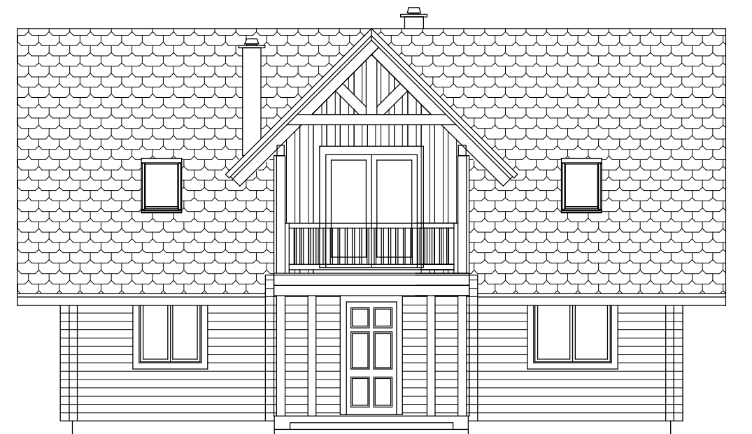
ELEWACJA FRONTOWA skala 1 : 100