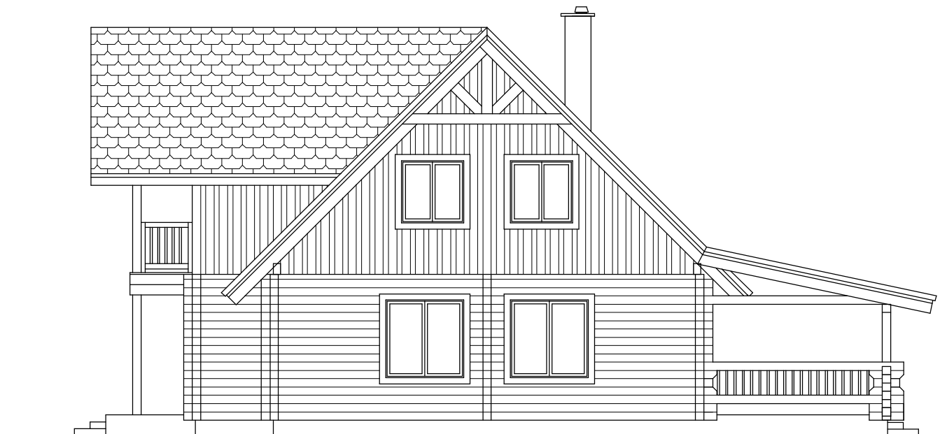
ELEWACJA BOCZNA skala 1 : 100